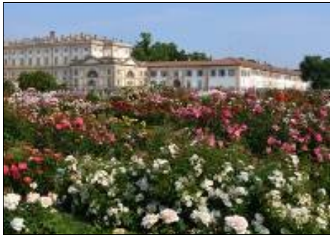
Roseto Niso Fumagalli, Villa Reale Monza

Monza, 24 maggio 2013 – Venerdì 24 maggio al Roseto "Niso Fumagalli" della Villa Reale di Monza, si tiene la 49ª edizione dei Concorsi Internazionali per Rose Nuove organizzati dall' Associazione Italiana della Rosa in collaborazione con l' Assessorato alla Cultura del Comune di Monza e con il patrocinio di Candy Group .