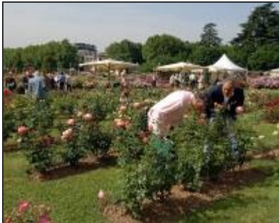
Giuria al lavoro